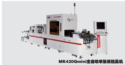
MK420Qmini全自动单张纸检品机